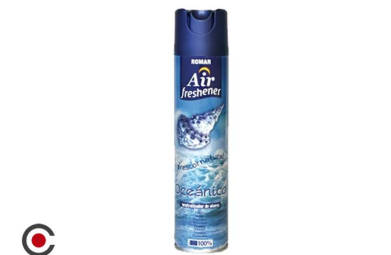
AMBIENTADOR SRAY ROMAR OCEANICO 300ML