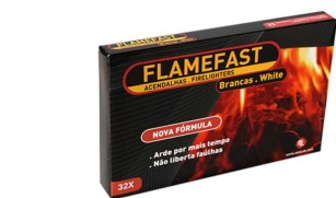
ACENDALHAS FLAMEFAST 32 CUBOS