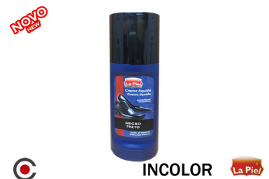
INCOLOR La Piel