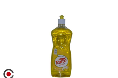
LAVA LOIÇA TANTO 1L