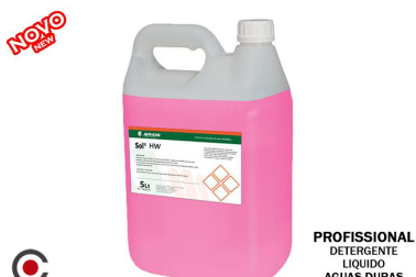
SOLIM DETERGENTE MAQUINA AG. DURAS 5.5KG