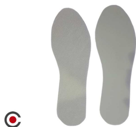
PALMILHA PAR LATEX PLUS 6210001