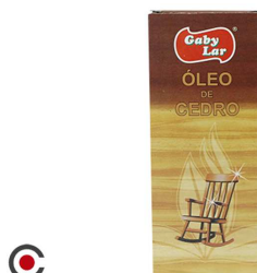
OLEO CEDRO 170 ML 671177