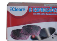
ESFREGÃO SABÃO NEO CLEAN 6 UNI