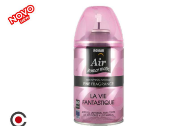
RECARGA SPRAY ROMAR FANTASTIC 250ML