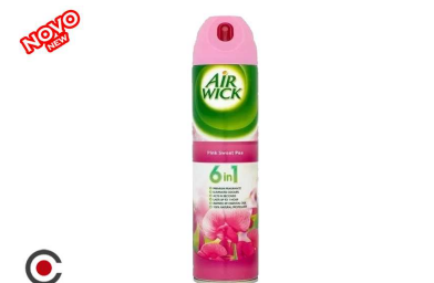
AIR WIC AMBIENTADOR 6/1 ROSAS 240ML