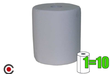
ROLO COZINHA MULTIUSOS BABIS 1=10