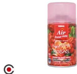
RECARGA SRAY ROMAR ROSAS 250ML