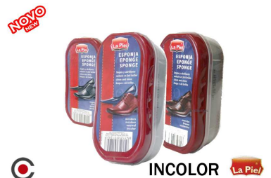
INCOLOR La Piel