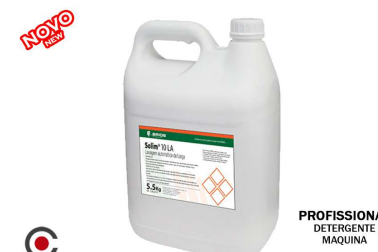
SOLIM DETERGENTE MAQUINA 10 LA 5.5KG