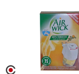
AIR WICK DIFUSOR ELETRICO ANTI TABACO 19ML