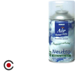
RECARGA SPRAY ROMAR NEUTRO 250ML