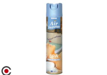
AMBIENTADOR SRAY ROMAR SPA 300ML