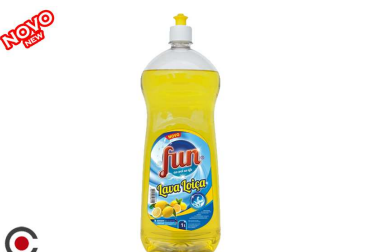
FUN LAVA LOIÇA LIMÃO 1L