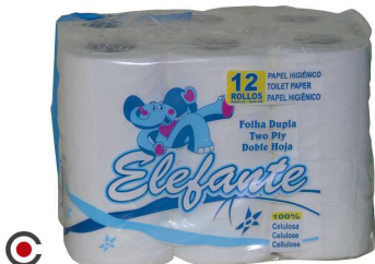
PAPEL HIGIÉNICO HELEFANTE 12 ROLOS