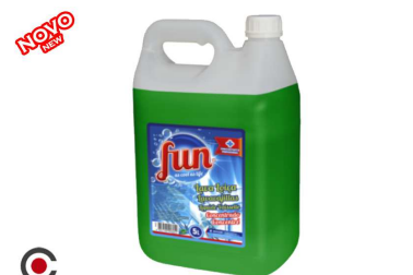
FUN LAVA LOIÇA MANUAL 5L