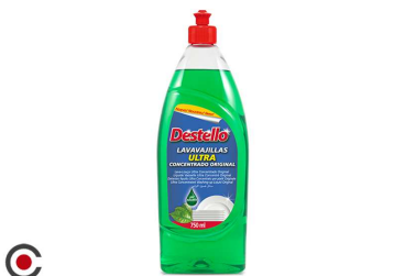
LAVA LOIÇA ULTRA CONC ORIGINAL DESTELLO 750ML