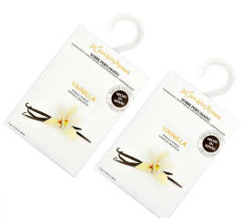
AMBIENTADOR SAQUETAS BAUNILHA 056186