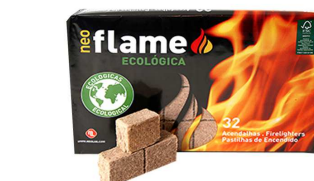
ACENDALHAS NEO FLAME ECO 32 CUBOS