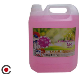
DETERGENTE SD ROSA TALCO 5L