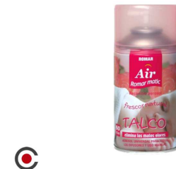
RECARGA SRAY ROMAR TALCO 250ML