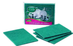
PACK 4 ESFREGOES LOIÇA VERDES R° 156