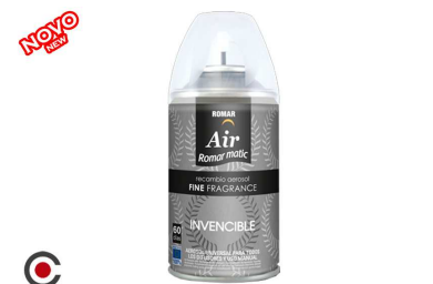
RECARGA SRAY ROMAR INVENCIVEL 250ML