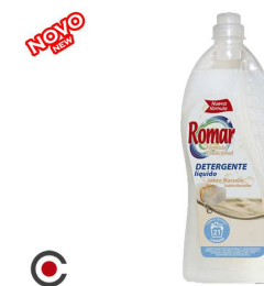
DETERGENTE ROUPA PRETA 1.5L