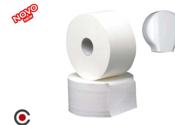
ROLO PAPEL HIGIENICO TISSU 88M