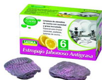
PACK 6 ESFREGÃO SABÃO R°25