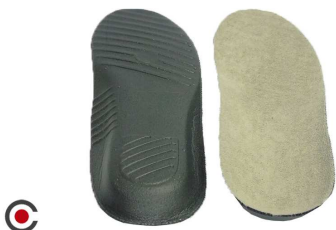
PALMILHA PAR DEPORTO ANATÓMICA 6210017