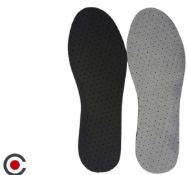
PALMILHA PAR LATEX CARBONO 6210003