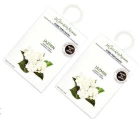
AMBIENTADOR SAQUETAS JAZMIM 057251