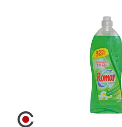
DETERGENTE GEL ROMAR ROUPA COLOR 2L