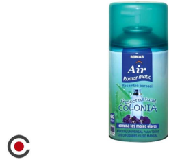
RECARGA SPRAY ROMAR COLONIA 250ML