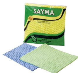
PACK 2 PANOS VEGETAIS R° 84