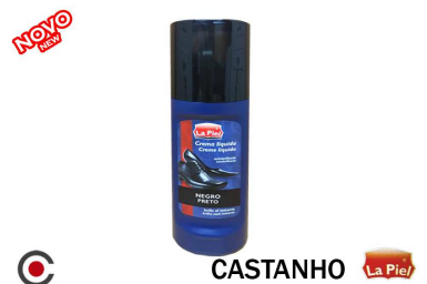
CASTANHO La Piel