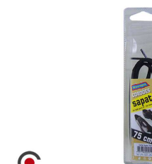
ATACADOR SAPATO 75CM 6210008