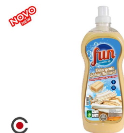
FUN DETERGENTE SABÃO NATURAL 22D 1.5L