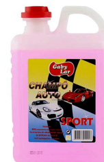
CHAMPOO AUTOMOVEL 1000 ML