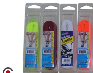
ATACADOR DESPORTO COLORIDO 120CM 6210006