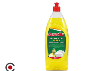
LAVA LOIÇA ULTRA CONC LIMAO DESTELLO 750ML