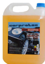
CHAMPOO AUTO CARPROTEC 5L