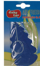
AMBIENTADOR PINHEIRO AUTO 141-010