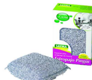
ESFREGÃO PRATA R°47