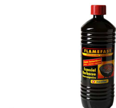
ACENDALHA LIQUIDA FLAMEFAST 1L