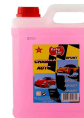
CHAMPOO AUTOMOVEL 2L