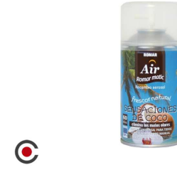
RECARGA SPRAY ROMAR COCO 250ML