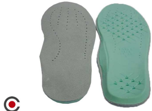
PALMILHA PAR RELAX ANATÓMICA 6210018