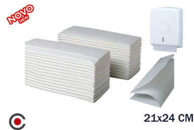
PACK 150 TOALHETES MÃO TISSU 21X24CM