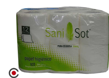
PAPEL HIGIÉNICO SANI-SOT 12 ROLOS