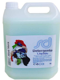
DETERGENTE SD ALOÉ VERA VERDE 5L