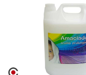
AMACIADOR SD CONCENTRADO SABÃO NATURAL 5L