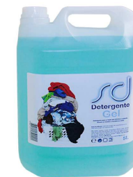
DETERGENTE SD AZUL GEL 5L