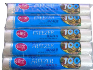
SACO CONGELAÇÃO ELITE 30X45CM 100UNI