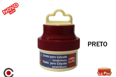
PRETO La Piel