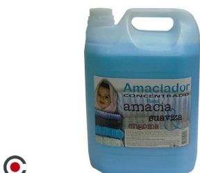
AMACIADOR SD CONCENTRADO FLORAL AZUL 5L