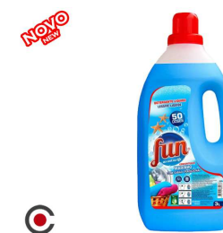
FUN DETERGENTE MARINHO 50D 3L