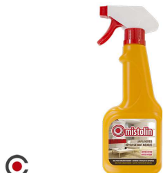
LIMPA MOVEIS ANTISTÁTICO 360ML