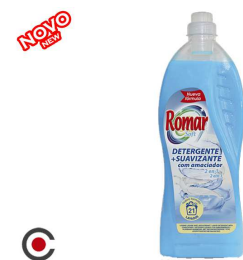
DETERGENTE SUAVIZANTE 2/1 SOFT 1.5L