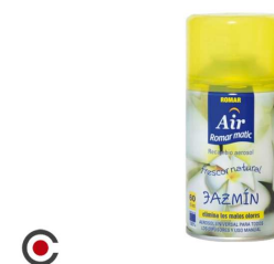
RECARGA SPRAY ROMAR JAZMIM 250ML