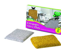
PACK 2 ESFREGÃO OURO/PRATA R°23