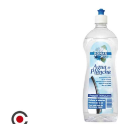
AGUA ENGOMAR PRIMAVERA ROMAR 1L