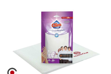
CLIN MASTERCHEF PANO ANTIBACTERIANO 50X50CM 17150