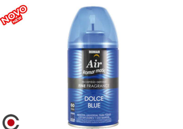
RECARGA SPRAY ROMAR FINE FR. DULCE BLUE 250ML