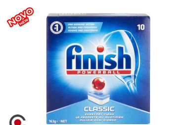
PASTILHAS MAQUINA FINISH 10UNI