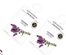
AMBIENTADOR SAQUETAS LAVANDA 056216