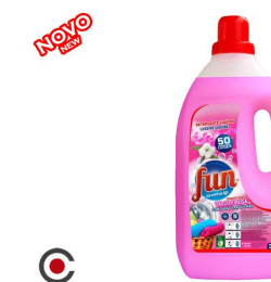
FUN DETERGENTE TALCO 50D 3L