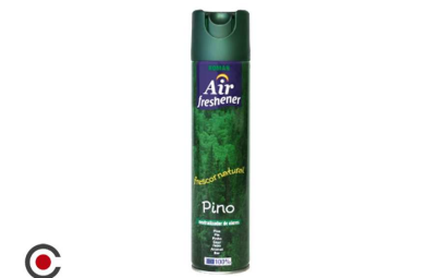
AMBIENTADOR SRAY ROMAR PINHO 300ML