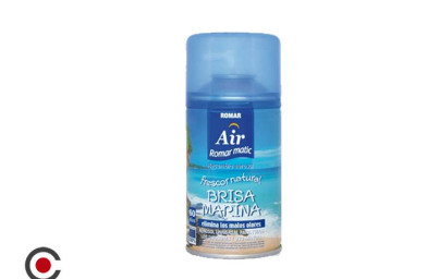
RECARGA SRAY ROMAR BRISA MARINA 250ML