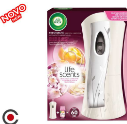
AMBIENTADOR + MAQUINA AIR WICK ROSAS 60DIAS