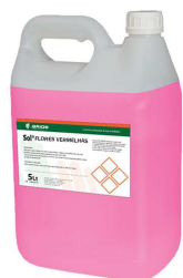
PROFISSIONAL DETERGENTE LIQUIDO