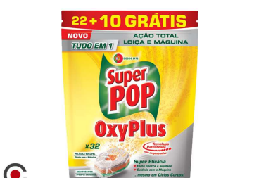
SUPER POP PASTILHAS OXYPLUS 22+10UNI