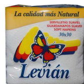
GUARDANAPOS LEVIAN 30X30 70UNI