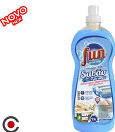
FUN DETERGENTE AZUL/BRANCO 22D 1.5L