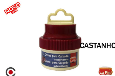
CASTANHO La Piel