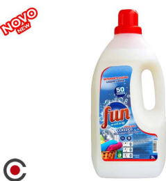
FUN DETERGENTE SABÃO 50D 3L