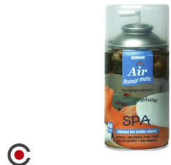
RECARGA SRAY ROMAR SPA 250ML