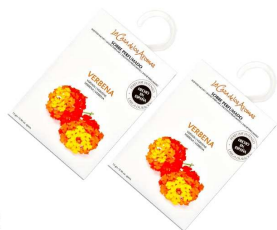
AMBIENTADOR SAQUETAS FLORES CAMPO 056230