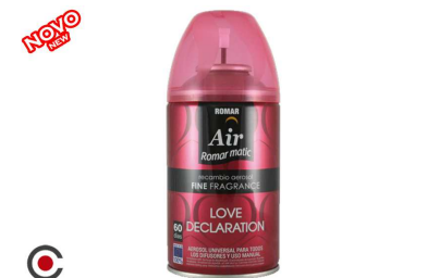
RECARGA SPRAY ROMAR FINE FR. LOVE 250ML