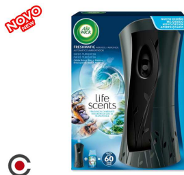
AMBIENTADOR + MAQUINA AIR WICK MARINHO 60DIAS