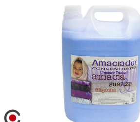
AMACIADOR SD CONCENTRADO ORQUIDEA LILÁS 5L