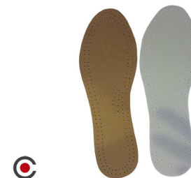
PALMILHA PAR PELE LATEX 6210004