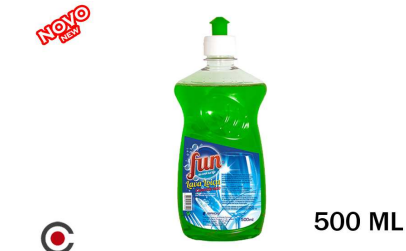
FUN LAVA LOIÇA 500ML