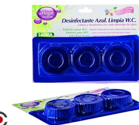
BLOCO SANITÁRIO 3 UNI WC R° 730