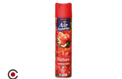
AMBIENTADOR SRAY ROMAR ROSAS 300ML