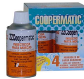
COOPERMATIC CARGA MOSCAS 250ML