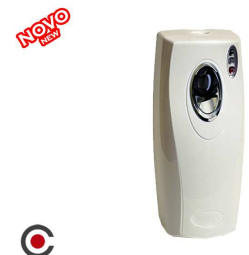
MAQUINA AUTOMATICA COPYMATIC 2863