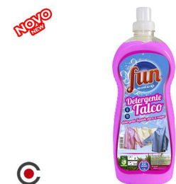
FUN DETERGENTE TALCO 22D 1.5L