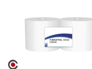
PACK 2 ROLOS PAPEL INDUSTRIAL 300M 2F