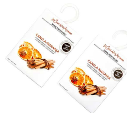
AMBIENTADOR SAQUETAS CANELA LARANJA 057015