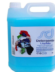
DETERGENTE SD AZUL 5L