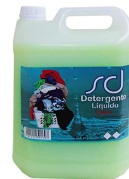
DETERGENTE SD VERDE COLONIA 5L