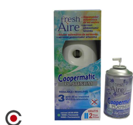
COOPERMATIC MAQUIMA + AMBIENTADOR E21930