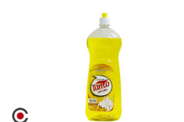
LAVA LOIÇA TANTO 1,5L