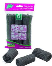
PACK 6 ESFREGOES AÇO R° 524