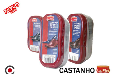
CASTANHO La Piel