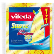
VILED A PACK 2 PANOS AMARELOS