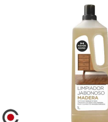
LIMPA MADEIRAS C/ SABÃO AGRADO 1000ML