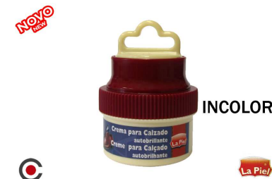
INCOLOR La Piel