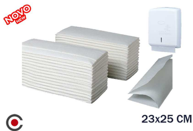
TOALHITA PAPELEIRA 23X25CM TISSU 160UNI