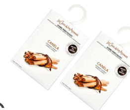
AMBIENTADOR SAQUETAS CANELA 056230