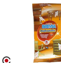
TOALHITAS LIMPA MOVEIS 15UNI