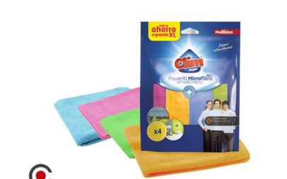
CLIN MASTERCHEF PACK 4 PANO 35X40CM 18121