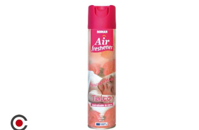
AMBIENTADOR SRAY ROMAR TALCO 300ML