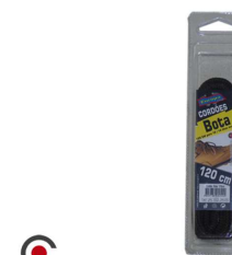
ATACADOR BOTA 120CM 6210007