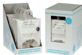
AMBIENTADOR SAQUETAS MARSELHA 056162