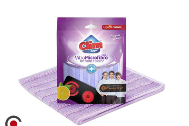
CLIN MASTERCHEF PANO VITROMICRO 32X32CM 51112