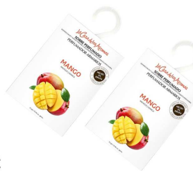
AMBIENTADOR SAQUETAS MANGA 057527