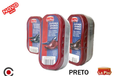
PRETO La Piel