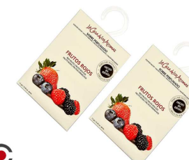
AMBIENTADOR SAQUETAS FRUT. VERMELHOS 056209