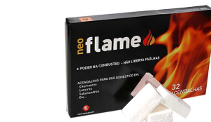
ACENDALHA NEOFLAME 32 UNI