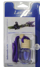
AMBIENTADOR AUTO LAVANDA 8ML 35018