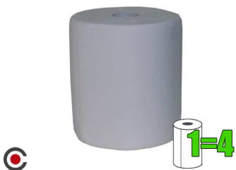
ROLO COZINHA MULTIUSOS BABIS 1=4