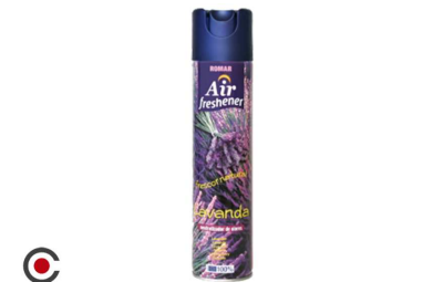
AMBIENTADOR SRAY ROMAR LAVANDA 300ML