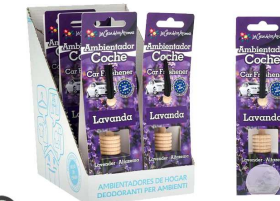
AMBIENTADOR AUTO LAVANDA 039776 10ML