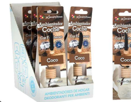
AMBIENTADOR AUTO COCO 039769 10ML