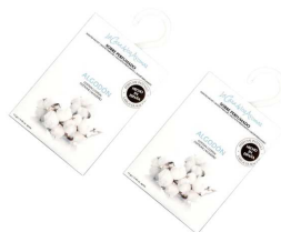
AMBIENTADOR SAQUETAS ALGODOM 056223