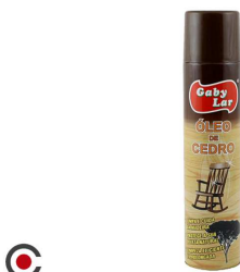
OLEO CEDRO SPRAY 300 ML 6710100