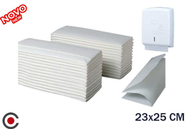
TOALHITA PAPELEIRA 23X25CM TISSU 160UNI