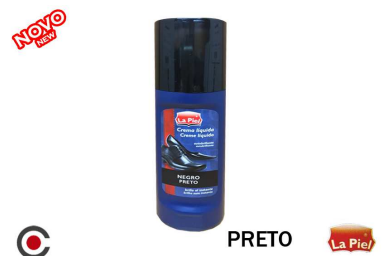
PRETO La Piel