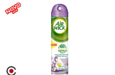
AIR WIC AMBIENTADOR 6/1 LAVANDA 240ML