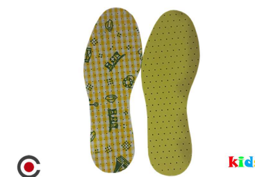
PALMILHA PAR INFANTIL KIDS 6210005