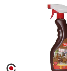
LIMPA MOVEIS PISTOLA GABLARA 5 EM 1 500ML