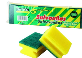
PACK 5 ESFREGÕES SALVA UNHAS R°857