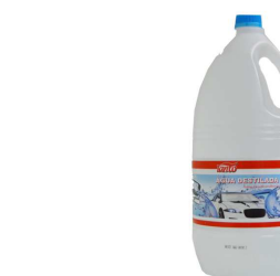
AGUA DESTILADA 5L