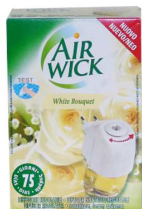
AIR WICK DIFUSOR ELETRICO BOUQUET 19ML