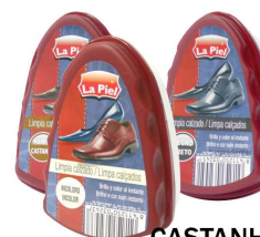
LA PIEL ESPONJA BRILHO CASTANHO 383