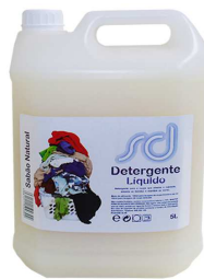
DETERGENTE SD BRANCO SABÃO 5L