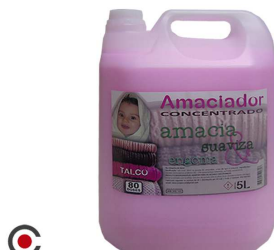
AMACIADOR SD CONCENTRADO ROSA TALCO 5L