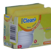
ESFREGÃO ESPONJA NEO CLEAN SALVA UNHAS