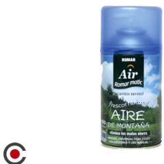
RECARGA SRAY ROMAR MONTANHA 250ML