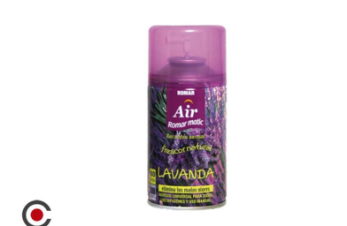
RECARGA SRAY ROMAR LAVANDA 250ML