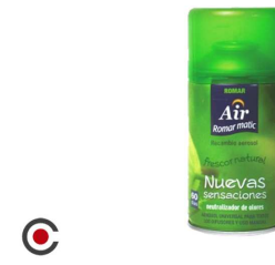
RECARGA SPRAY ROMAR NOVAS SENSACÕES 250ML