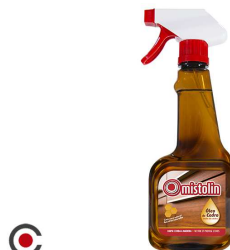
OLEO DE CEDRO PISTOLA MISTOLIM 380ML