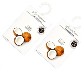
AMBIENTADOR SAQUETAS COCO 056193