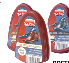
LA PIEL ESPONJA BRILHO PRETO 383