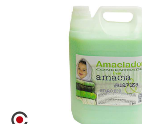
AMACIADOR SD CONCENTRADO VERDE 5L