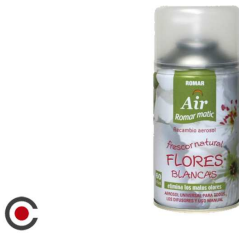
RECARGA SPRAY ROMAR FLORES BRANCAS 250ML