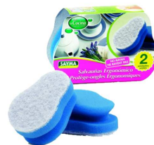
PACK 2 ESFREGOES LOIÇA SALVA UNHAS R° 33