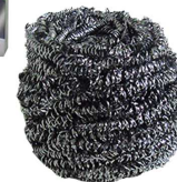
PACK 2 UNI