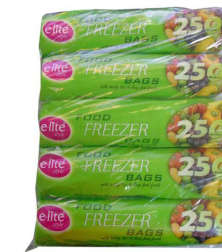
SACO CONGELAÇÃO ELITE 22X33CM 250UNI