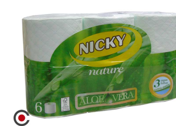
PACK 6 ROLOS HIGIENICO NICKY MAXI 2F