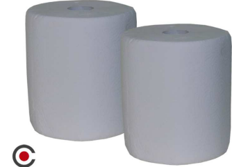
PACK 2 ROLOS COZINHA AHORRO 2=12