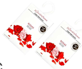
AMBIENTADOR SAQUETAS ROSAS 057022