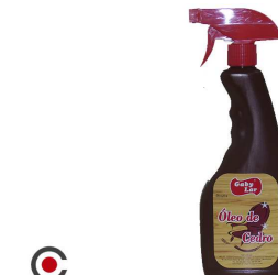
OLEO CEDRO PISTOLA 400 ML