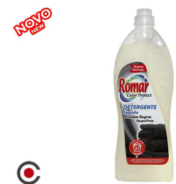
DETERGENTE SABÃO NATURAL 1.5L