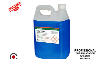
SOLIM SECANTE ABRILHANTADOR MAQUINA 5L