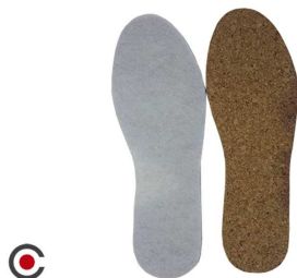
PALMILHA PAR CORTIÇA 6210002